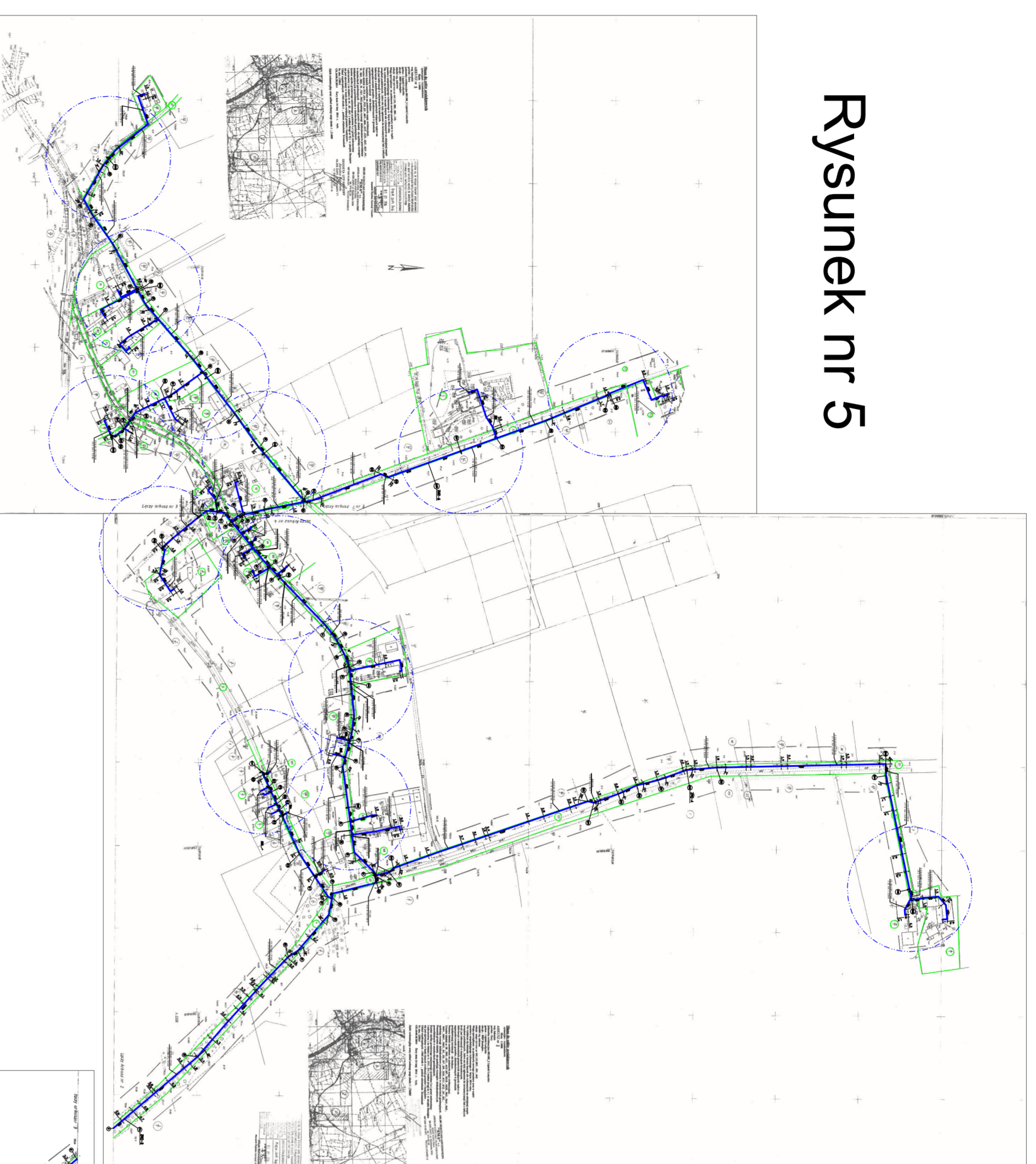
Rysunek nr 5